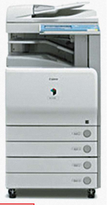
Remote UI功能介面操作簡易，有助管理資源。

Canon iRC 3380i具備 Remote UI功能，簡化行政部的工作之餘，更有助控制成本，大幅度減省不必要的印刷開支。