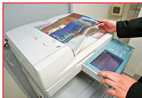
Canon多功能打印系統介面操作簡易，方便員工使用。

值得一提的是，原來中原地產的辦公室裡貼有不少「溫馨提示」，建議員工多使用如雙面列印等環保之道，而Canon多功能打印系統的雙面打印功能方便可靠，助企業推廣環保概念，成效相當顯著。